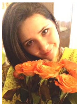
Янина ДОБРОНЕВСКАЯ (меццо-сопрано)